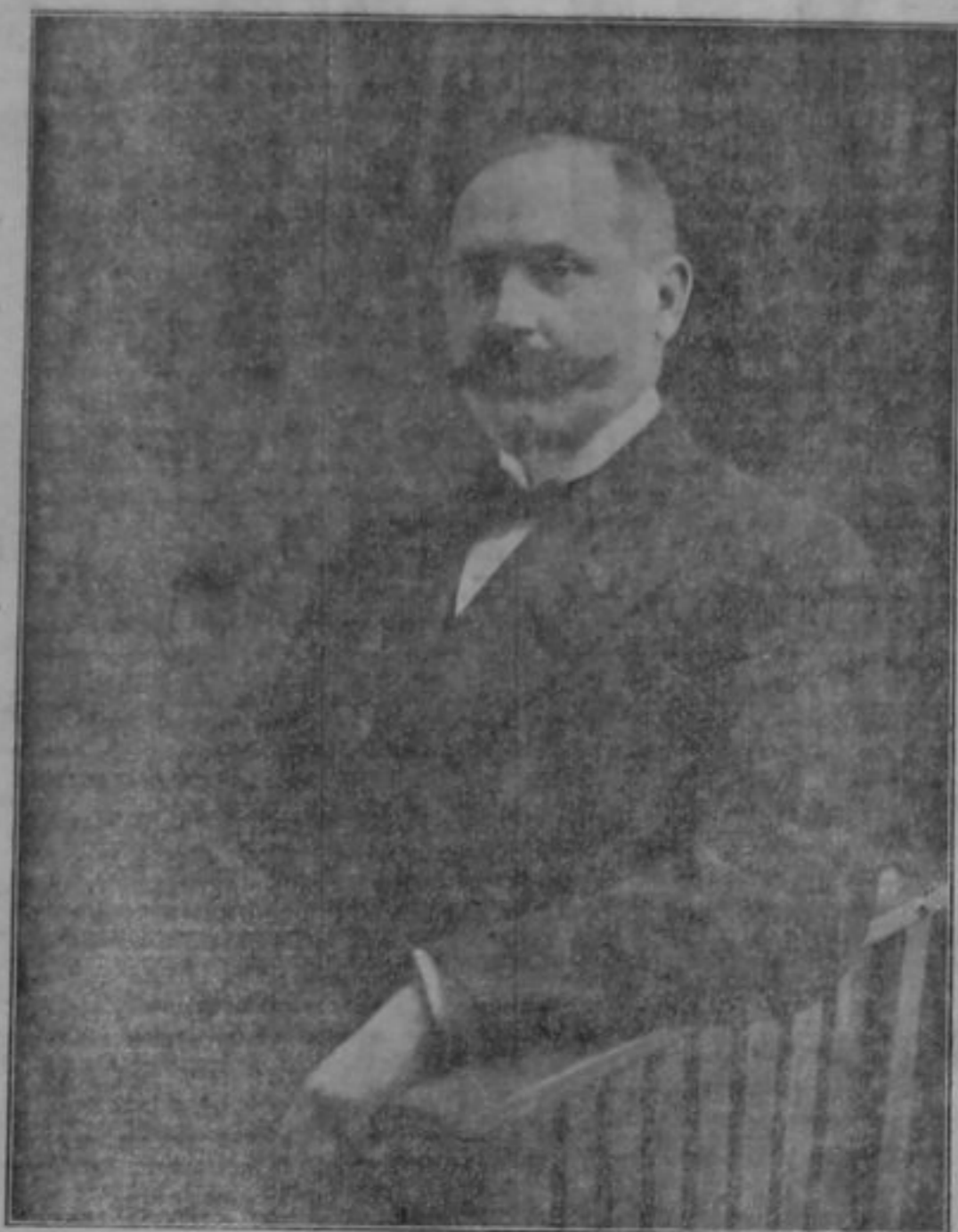
Граф П. И. Игнатьев. (Къ назначенію управляющимъ министерствомъ народного просвѣщенія.)

Новый глава учебного ведомства. Назначение нового главы нашего многообразного учебного ведомства встречено общим сочувствием и доверием печати и политическими кругами. Графу П. И. Игнатьеву приходить, таким образом, вступить в управление министерством народного просвещения при очень добрых предположениях. И знаю графа П. И. Игнатьева довольно давно и думаю, что русское общество не ошиблось: новый глава учебного ведомства несет нашей школе и обществу мир, а не войну. Смысл знаменитого отца, графа П. И. Игнатьева усматривалось от него вкратце в изречениях его большой, государственной широты, ума и замечательной такти. В этом надо проследить изумительную работоспособность графа и его общественно-служебный талант. Новый министр — не петербургский бюрократ, а провинциальный общественный деятель,